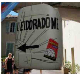
À Avignon, un simple bidon devient un panneau indicateur idéal.